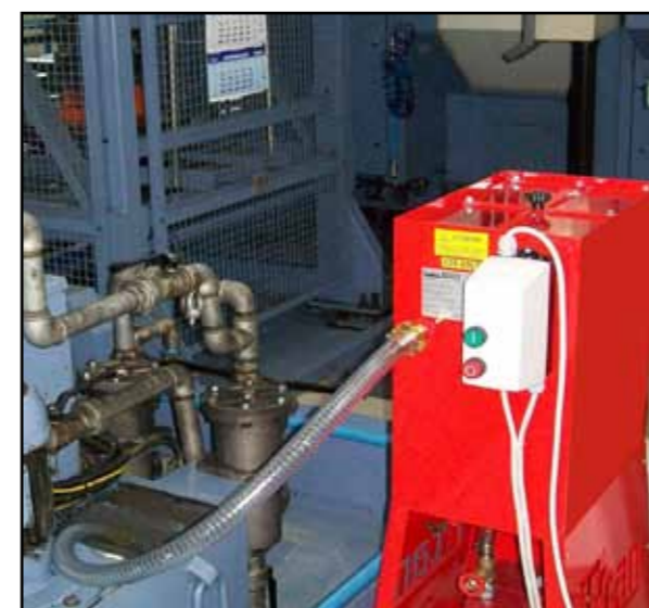
TYPE DC-T1 CARRELLATO CON POMPA ELETTRICA