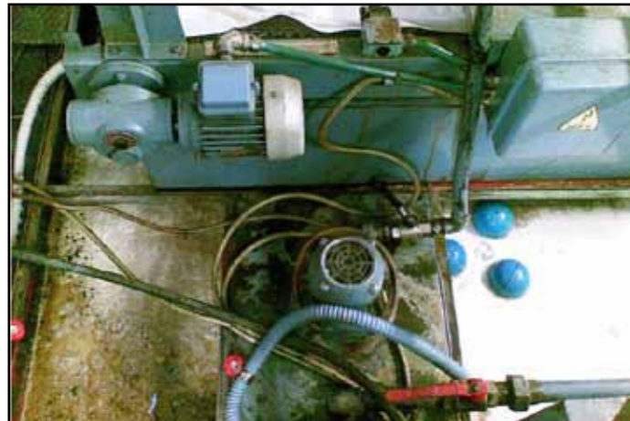
TYPE DC-TM: CENTRO DI LAVORO MCM VASCA DISOLEATA IN 20 MINUTI DI LAVORO