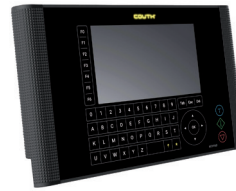
| COUTH® Keypad

Con una sola HMI si potranno gestire molteplici COUTHsmartbox .