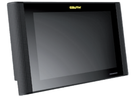
| COUTH® Touchscreen