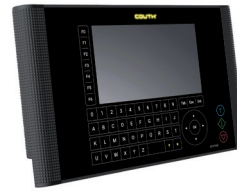
| COUTH® Keypad

Con una sola HMI si potranno gestire molteplici COUTHsmartbox .