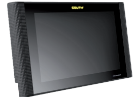
| COUTH® Touchscreen