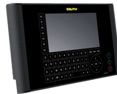
| COUTH® Keypad

Con una sola HMI si potranno gestire molteplici COUTHsmartbox .