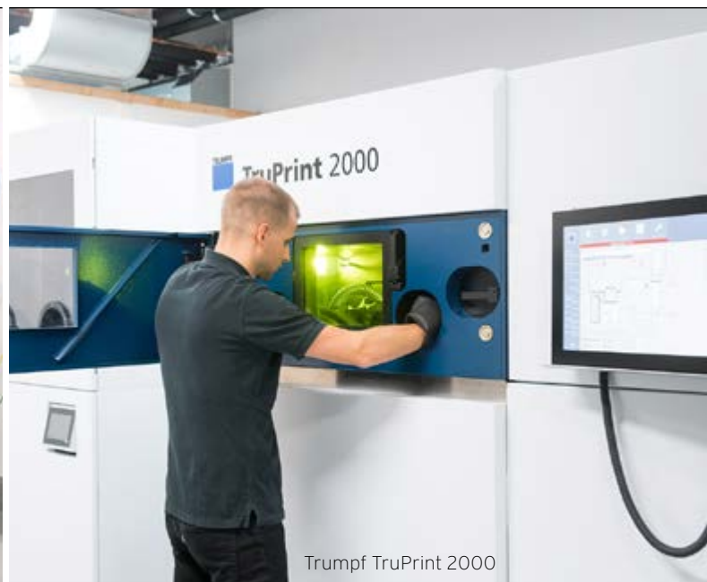
Trumpf TruPrint 2000

so integrato nella corona del pistone che non sarebbe stato possibile con la produzione convenzionale. La produzione con AM permette un'alta riproducibilità e non sono necessari passaggi manuali».