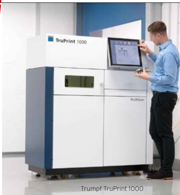
Trumpf TruPrint 1000