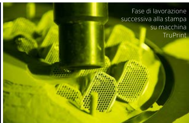
Fase di lavorazione successiva alla stampa su macchina TruPrint