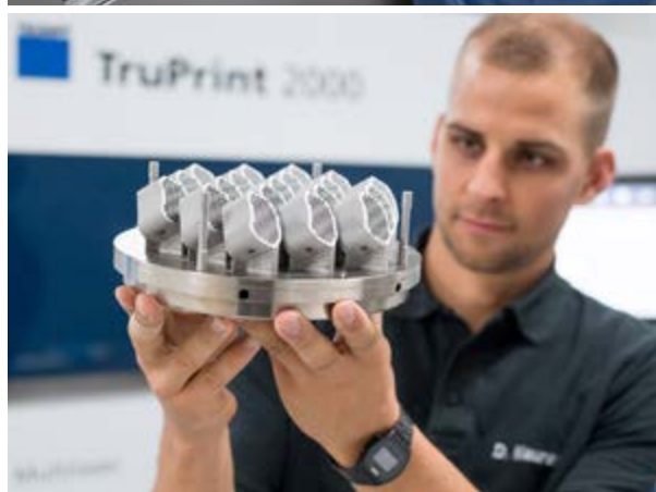
In un solo processo di stampa queste 19 parti sono state prodotte dalla TruPrint 2000

Trumpf nasce nel 1923 come officina meccanica, ma si è sviluppata nel tempo fino a diventare una delle aziende di spicco nel campo delle macchine utensili, delle tecniche laser e dell'elettronica per applicazioni industriali. Nell'esercizio 2018/19 l'azienda ha registrato un fatturato di 3.784 milioni di euro con 14.490 dipendenti. L'azienda tedesca sviluppa e produce internamente la sorgente laser dei suoi sistemi per la manifattura additiva, e questo permette a Trumpf di far evolvere rapidamente la tecnologia additive e di scoprire nuove applicazioni. Mira a sviluppare ulteriormente la tecnica di produzione, rendendola redditizia, precisa, pronta per il futuro e connessa. Propone soluzioni software che spianano la strada verso la smart factory, e nell'elettronica industriale rendono possibili processi high-tech. La sua filosofia è infatti quella di produrre macchine che possano dialogare tra di loro proprio nell'ottica di una fabbrica intelligen-