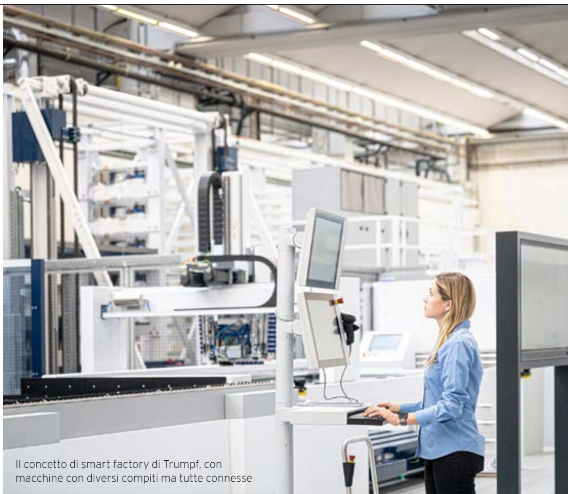
Il concetto di smart factory di Trumpf, con macchine con diversi compiti ma tutte connesse

LA TECNOLOGIA LMF, LASER METAL FUSION, È LA BASE DELLE QUATTRO STAMPANTI 3D DELLA GAMMA TRUPRINT DI TRUMPF. LE CARATTERISTICHE E I VANTAGGI SONO STATI ILLUSTRATI NEL CORSO DI UN WEBINAR ORGANIZZATO DAL GRUPPO TEDESCO E DA RIDIX, LA SOCIETÀ ITALIANA CHE DA QUASI DUE ANNI HA STRETTO UN FORTE ACCORDO DI COLLABORAZIONE CON TRUMPF