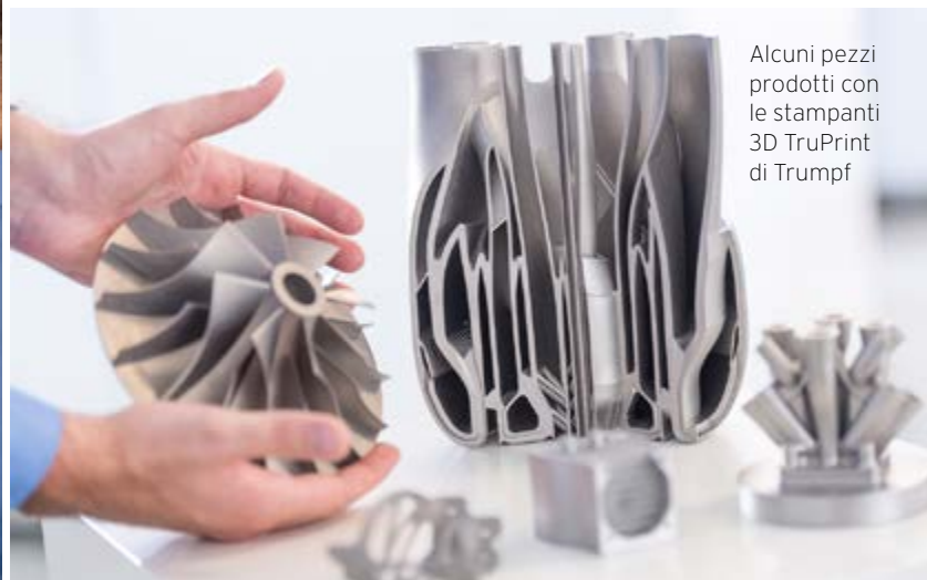
Alcuni pezzi prodotti con le stampanti 3D TruPrint di Trumpf