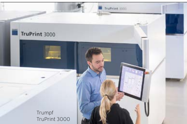
Trumpf TruPrint 3000