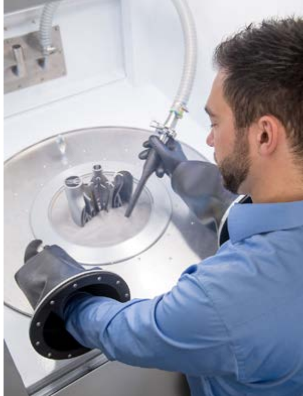
Un operatore esegue le fasi di post lavorazione necessarie dopo una sessione di stampa con la tecnologie LMF